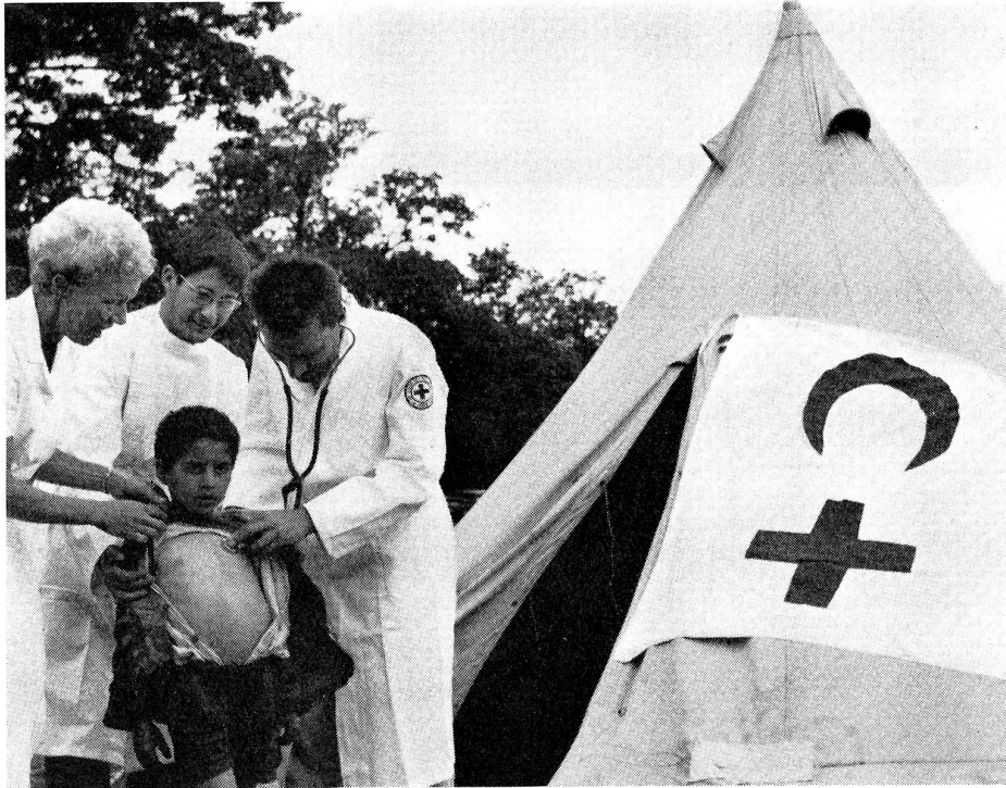
Une mission de la Croix-Rouge examine des réfugiés algériens au camp de Ain Soltane