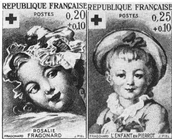
Les deux timbres de Noël 1962 de la Croix-Rouge française

Une nouvelle oblitération de propagande est utilisée depuis le 2 novembre 1962 par la Ligue des sociétés de la Croix-Rouge avec l'affranchissement mécanique