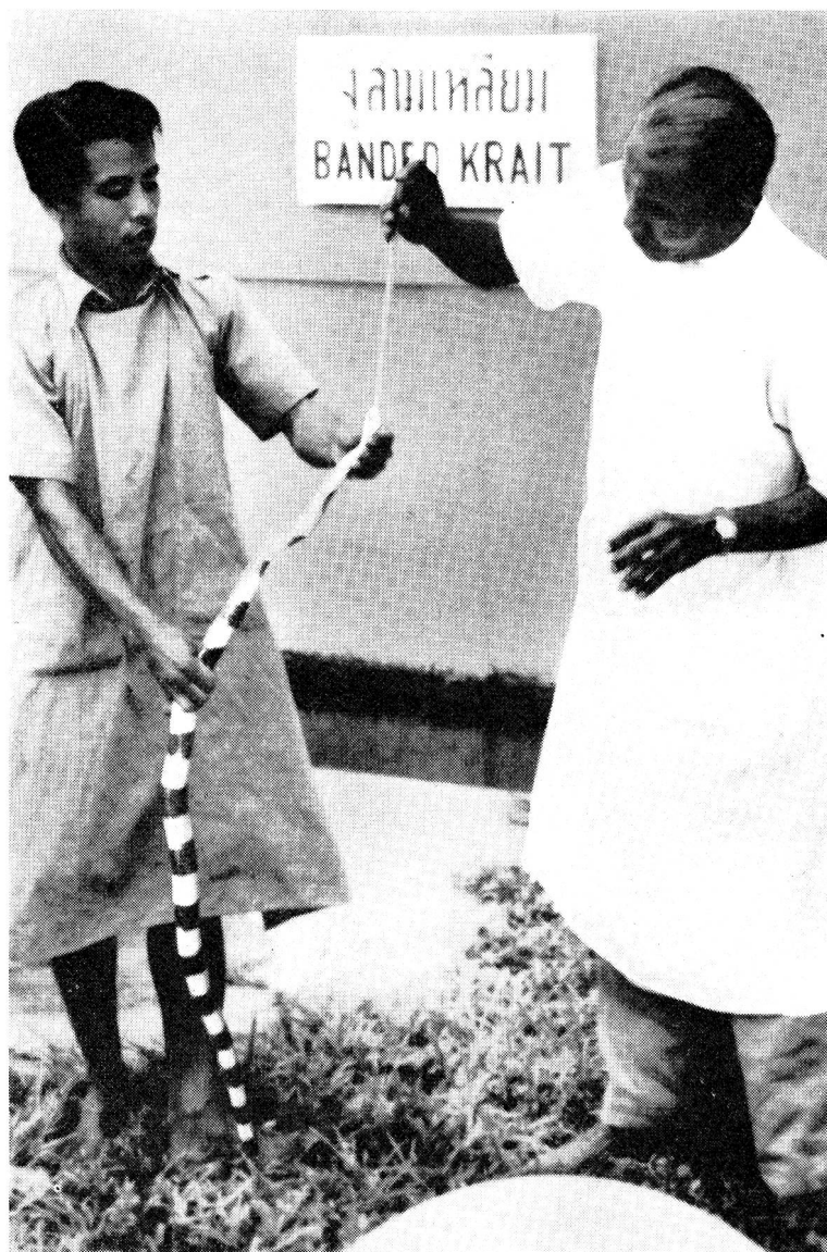
L'extraction du venin