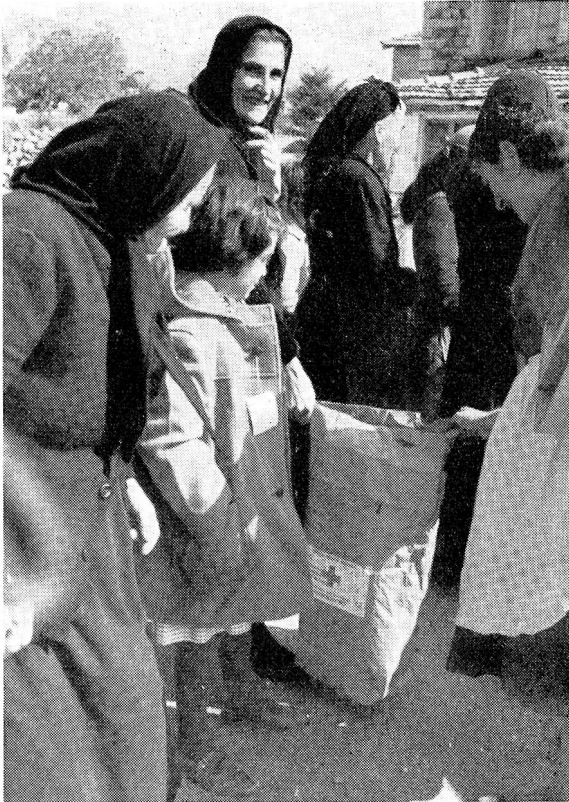
Enfants, mères et grand-mères contemplant le contenu des « merveilleux » sacs venus de Suisse! Leurs cœurs débordent de reconnaissance sincère: « dites bien merci de notre part aux généreux donateurs! »

cipe à la réfection des maisons de familles dont un membre est atteint de tuberculose et dont un ou plusieurs enfants ont séjourné au Préventorium de Microcastro. Cette année, 159 familles bénéficieront de cette forme d'aide si appréciée et qui est apportée dans le cadre de la lutte antituberculeuse menée depuis quelques années avec beaucoup d'intensité, en Grèce septentrionale, par les autorités du pays et la Croix-Rouge hellénique. En outre, notre déléguée a sélectionné 111 enfants et 282 vieillards qui bénéficieront d'un parrainage, les premiers sous forme d'un colis de vêtements et de vivres, les seconds sous forme de la remise périodique de denrées alimentaires ou de petites sommes d'argent.