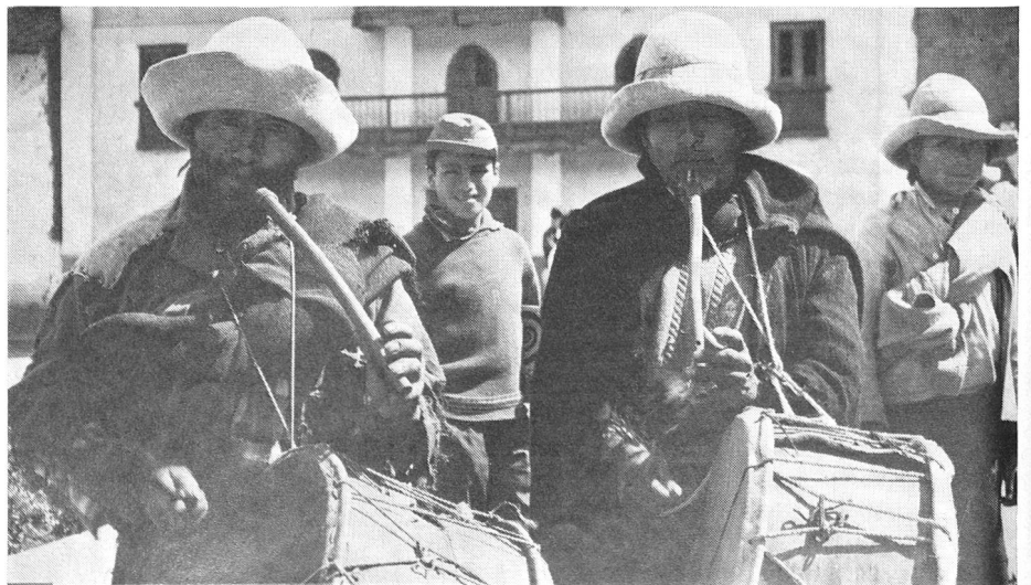
Les musiciens du village soutiennent l'ardeur au travail des ouvriers.

Le soir, une fête fut organisée en notre honneur. On échangea des toasts; à tour de rôle, les gens venaient s'asseoir près de nous, ressemblaient leur anglais scolaire et nous parlaient de la chère Suisse, nous posaient des questions à son sujet, nous enseignaient des danses péruviennes et buvaient derechef à notre santé. Vers minuit, Monsieur Steiner obtint d'un paysan la promesse de mettre dix ânes à disposition pour transporter des caisses au chantier. Plus tard, l'architecte