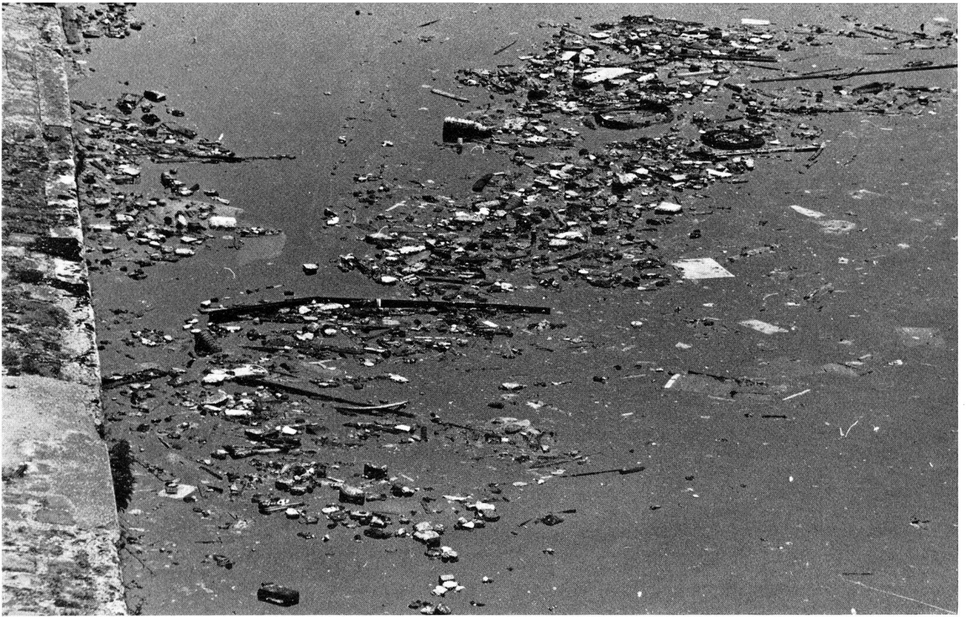
A Paris, canetons et débris flottent de concert sur la Seine. Tout comme le problème de la fourniture d'eau potable, celui de l'élimination des déchets affecte l'ensemble de l'hygiène du milieu d'une communauté.