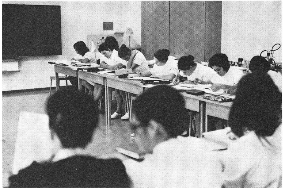
Prima che sul letto del malato bisogna chinarsi sui libri