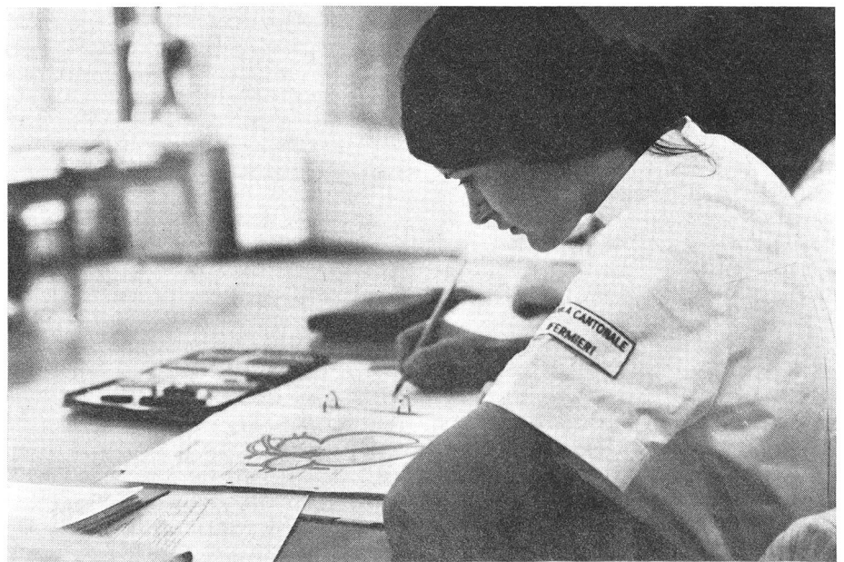
Disegnare significa individuare i punti nevralgici dello studio