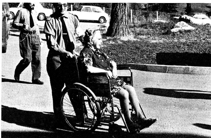
Chaque soldat était tout dévoué à «son» patient.