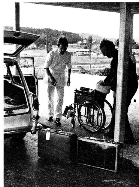
Après avoir quitté leur domicile ou le home où ils sont soignés, les invalides sont confiés aux troupes sanitaires qui voyagent avec eux en wagons réservés jusqu'à Fiesch.

Il ne faudrait surtout pas croire que les handicapés allaient servir de cobayes à la troupe. Toute la mise sur pied du camp a été faite en tenant rigoureusement compte d'un principe directeur: les «invités» devaient se sentir vraiment en vacances et non pas à l'hôpital. Un programme varié de distractions, de jeux et de divertissements avait été minutieusement préparé, sans que rien ne soit négligé pour assurer les soins qu'exigeait l'état de ces invalides atteints d'hémiplégie, de tétraplégie, de sclérose en plaques et autres graves infirmités, se déplaçant pour la plupart uniquement en chaise roulante. Chacune des cinq stations de traitement du camp de vacances comptait un médecin, deux infirmières, deux sous-officiers et 28 soldats sanitaires,