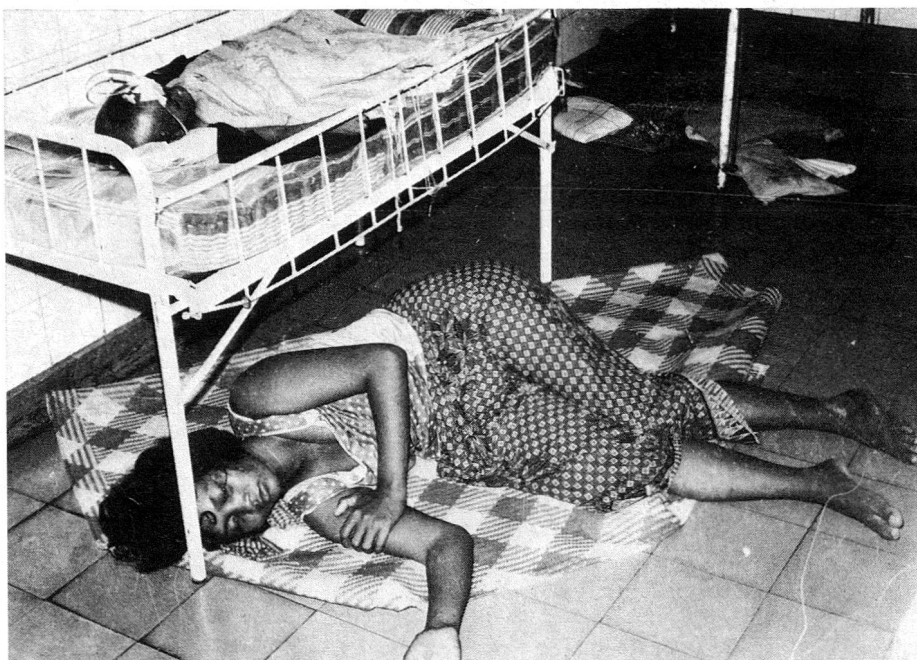
Les mères passent la journée et la nuit auprès de leur enfant malade hospitalisé.

Un coup d'œil jeté sur la statistique établie pendant les cinq derniers mois de 1973 permet de saisir que, comme dans tous les hôpitaux d'enfants installés dans les pays tropicaux, la malnutrition et les affections