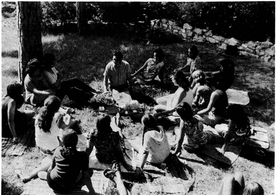
Corso di pronto soccorso all'aperto.

Sui diari scrivono cose divertenti. Eccone alcune, frutto delle lezioni d'italiano che ci si preoccupa di impartir loro.