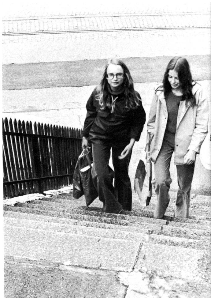
Une douzaine de marches raides à gravir et l'on arrive au domicile des deux vieilles dames – des sœurs – qui habitent ici «depuis toujours». Elles seraient si peinées de devoir quitter leur chère maison. Mais, l'infirmière visiteuse passe chaque jour pour donner quelques soins à l'ainée et une femme de ménage vient régulièrement mettre un peu d'ordre. Comme elles ne peuvent plus guère sortir, elles attendent impatiemment l'arrivée des deux jeunes filles qui se sont offertes à faire leurs emplettes, à remplir un mandat puis à le porter à la poste, à leur monter charbon et bois.

Laissons parler la responsable de ce service: «Nous avons pris contact avec ces jeunes et les avons informés de façon approfondie sur le caractère de notre assistance aux personnes âgées, sur le psychisme des malades et des personnes du 3e âge, sur leurs aspirations aussi. Nous avons souligné qu'un tel engagement exigeait beaucoup de compréhension et de patience, qu'ils ne devaient pas se bercer de l'illusion qu'ils n'auraient qu'affaires à de gentils grands-pères et grands-mères. Nous leur avons dit aussi que ceux d'entre eux qui ne se sentaient pas prêts à affronter, sous cette forme, des contacts parfois difficiles feraient mieux de renoncer tout de suite. Nous ne rendons,