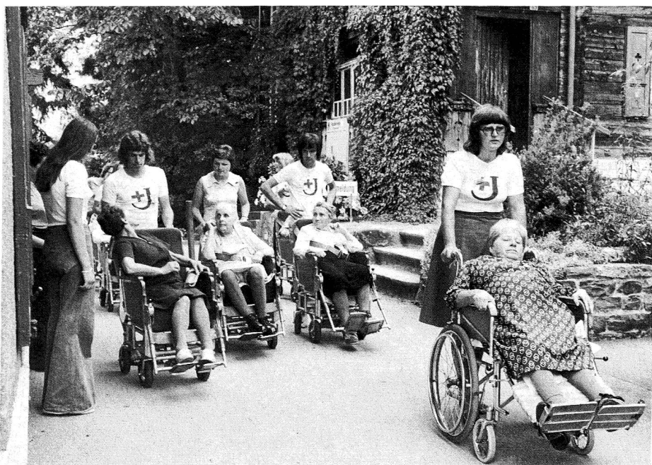
Alcune ore passate con invalidi mettono i giovani in contatto con problemi che forse non conoscevano ancora

I campi per la gioventù, voluti dalla Croce Rossa svizzera, servono alla diffusione dei sentimenti di solidarietà tra gli individui, alla preparazione dei giovani al pronto soccorso e alle cure agli ammalati, e, grazie alla presenza dei docenti, ad un'intensa informazione sugli scopi della Croce Rossa nelle scuole svizzere. Ci si augura che molti altri cantoni traggano profitto da queste occasioni.