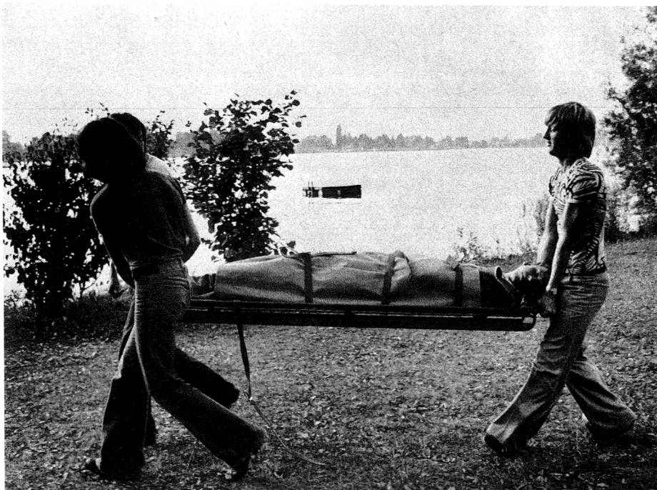
Il pronto soccorso...