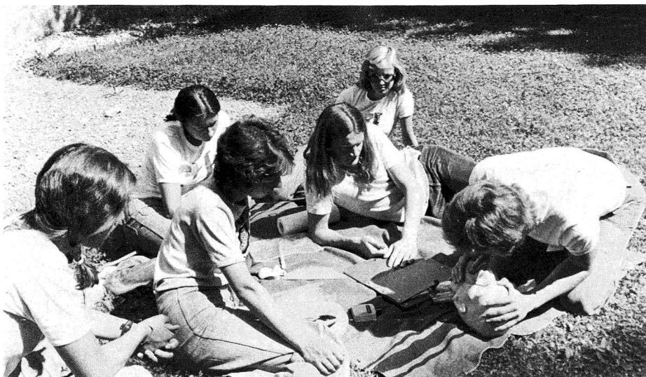
Si insegnano pure i metodi di rianimazione di un ferito o di un annegato.

professata da un'istituzione vecchia di 112 anni costituiscono le fondamenta dell'informazione data ai futuri maestri.