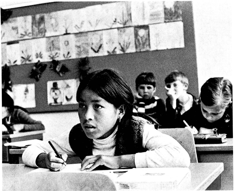
Les enfants fréquentent nos écoles, les adolescents suivent une formation professionnelle conforme à leurs aptitudes...