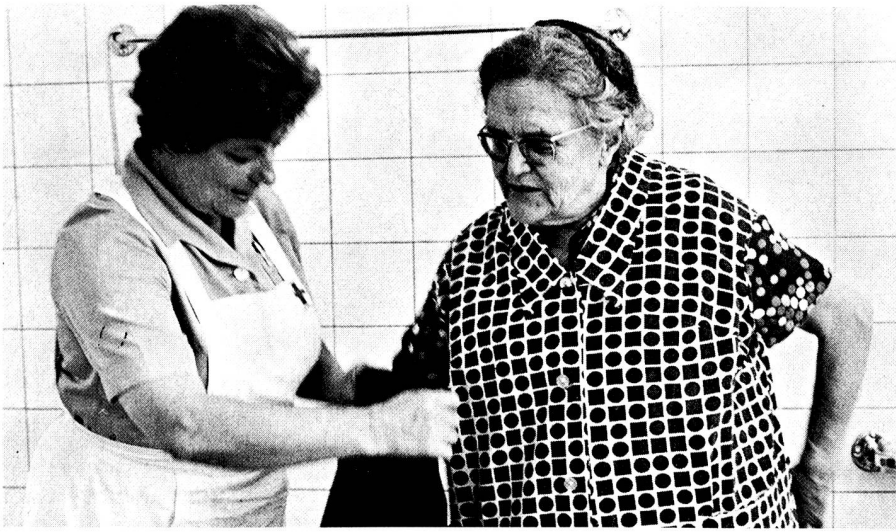
Aider une vieille personne à se laver et à s'habiller... Des gestes simples, mais combien utiles...