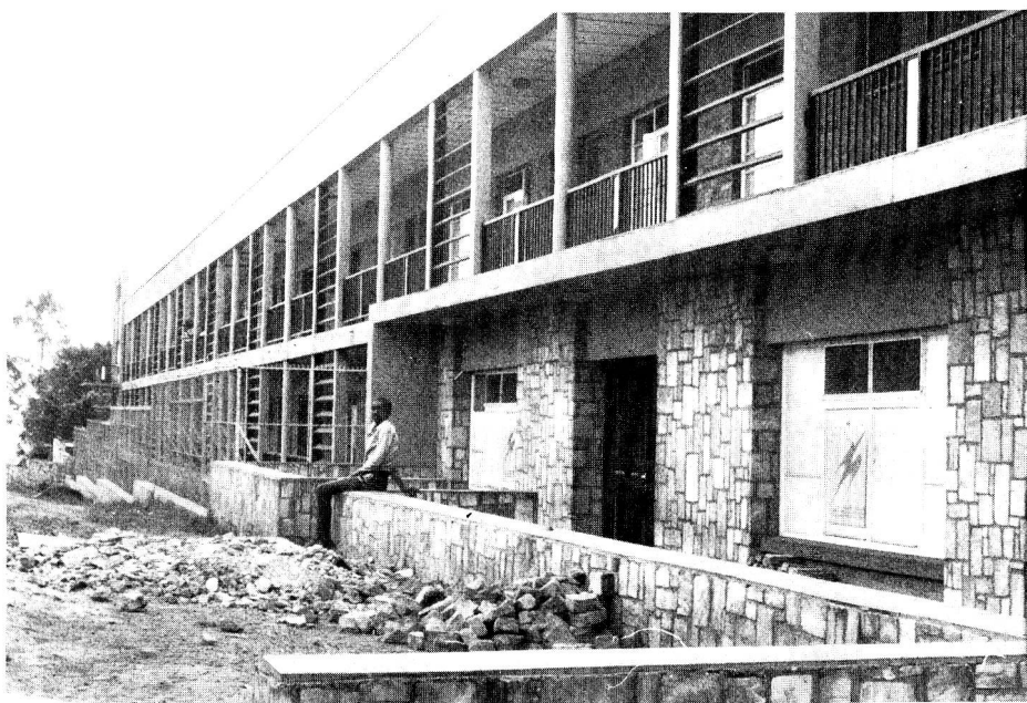
Centre de transfusion de sang à Kigali – clinique.

Nos lecteurs se souviendront peut-être que nous avons consacré bon nombre de pages à la Croix-Rouge du Rwanda et à notre intervention en faveur de ce pays dans notre numéro de juin 1972. Rappelons que de 1970 à 1973, une délégation de la Croix-Rouge suisse a aidé sa société sœur du Rwanda à développer ses activités et à structurer son organisation. Cette assistance, financée pour moitié par le