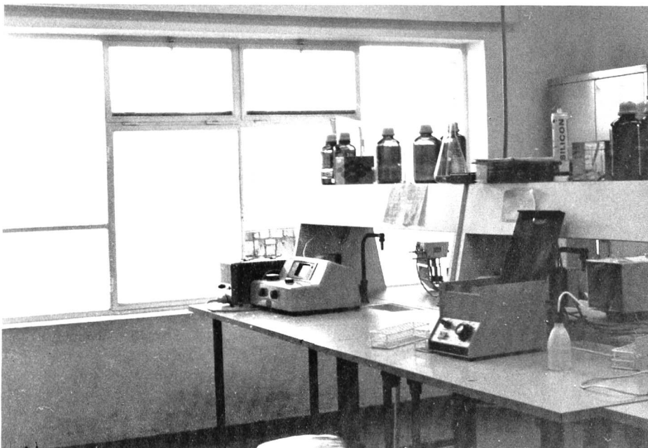
Un des laboratoires du centre.