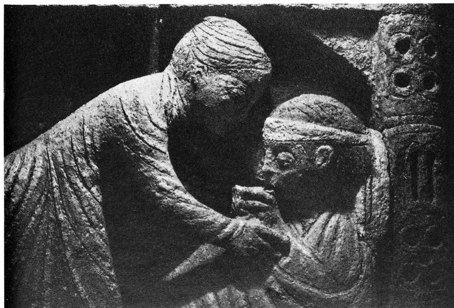
Sculpture et bas-reliefs de Margrit Kovacs, célèbre céramiste hongroise (1902-1977).