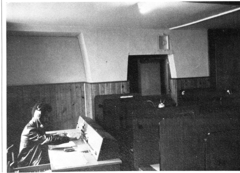
Le centre est muni d'un laboratoire de langues très perfectionné.