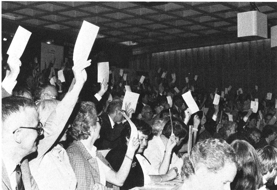
Vote à main levée pour les affaires courantes,

On prévoyait, certes, que cette assemblée, au cours de laquelle devait être élu le nouveau président central de la Croix-Rouge suisse, attirerait un nombreux public, mais la quote des pronostics fut si largement dépassée que l'on dut, en dernière minute, se mettre en quête de locaux de réunion plus vastes que ceux qui avaient initialement été choisis!