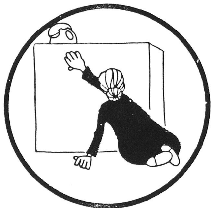
Problemi umani a domicilio (?)