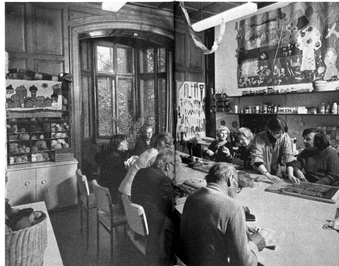
Une séance d'ergothérapie d'animation pour ces patients d'un home de jour.

– que cette thérapie occupe une place toujours plus importante dans le cadre des soins extra-hospitaliers. De nombreux exemples positifs sont là pour en témoigner.