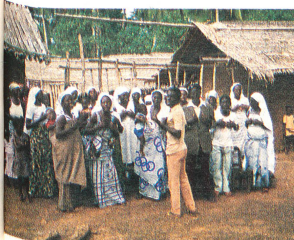
Le Club des mères de la Croix-Rouge locale a pour objectif d'améliorer les conditions d'hygiène et d'alimentation des enfants dans les régions occidentales du pays. Les hommes entraînent les règles devant fournir pendant deux jours un travail au profit de la communauté.

Sur le plan humain, l'une des expériences les plus surprenantes pour un néophyte est l'accueil réservé par les villages. A chaque endroit visité, le véhicule de la Croix-Rouge est reçu avec des démonstrations de joie. Présence de l'homme blanc qui entraîne un peu de distractions dans la vie quotidienne ou alors véritable reconnaissance envers l'aide apportée? Peut-être les deux, peut-être encore plus. Mais, quelles que soient les raisons, il est évident que les villageois sont fiers de