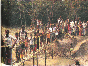
Des citoyens aisés ont fait don d'un terrain sur lequel vingt maisons ont pu être construites du profit de sans-abris. A l'occasion de la fête qui a marqué ce don, tous les bénéficiaires se rassemblèrent sur la rive voisine.

n'est pas toujours allée de soi: à un endroit, la police a dû protéger l'envoyé de la CRBD contre les attaques d'un groupe de miliciens détaché par un grand propriétaire foncier.