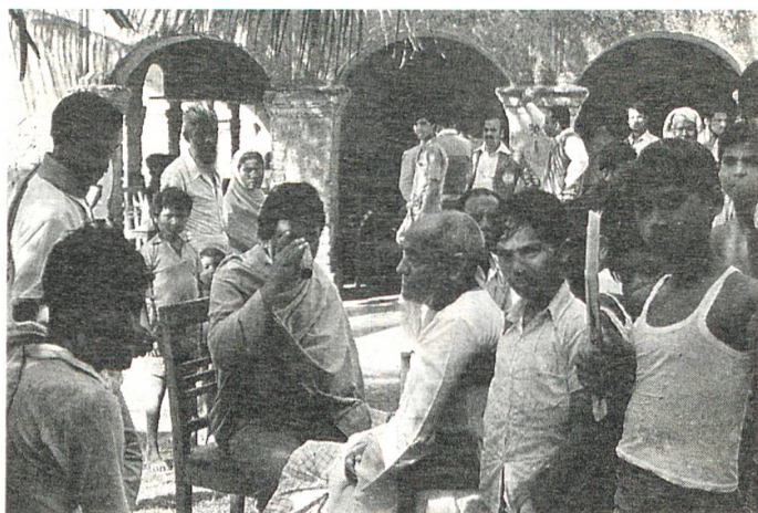
Bénéficiaires et collaborateurs de la CRBD après la fête.