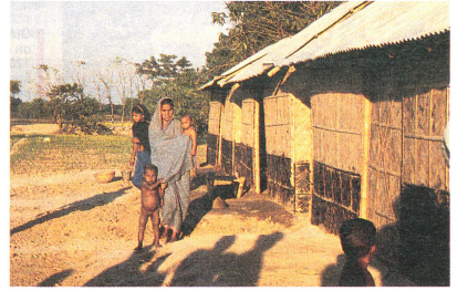
Toutes les maisons sont construites selon l'usage du Bangladesh: entrelacement de bambous fixés sur des montants de bambou.

Avant de procéder au choix, la situation économique et sociale des familles a été examinée minutieusement. Parfois, les employés de la CRBD ont même visité de nuit le domicile des intéressés, pour voir si les données contenues dans les questionnaires étaient exactes. Sur les 400 familles, toutes étaient pour ainsi dire sans terres et sans véritable logement. Elles comptaient en