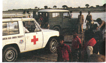
Les collaborateurs de la CRBD sont souvent en route des jours entiers. La traversée d'un fleuve en bac fait partie du quotidien.

Une année plus tard, j'ai à nouveau perdu ma maison durant les inondations (1983). Comme je n'avais plus d'argent pour la rebâtir, nous vivions sous la véranda de la maison de mon oncle et parois sous les arbres.»