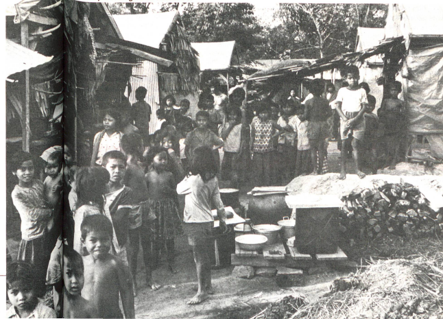
Camp de réfugiés en Thaïlande.