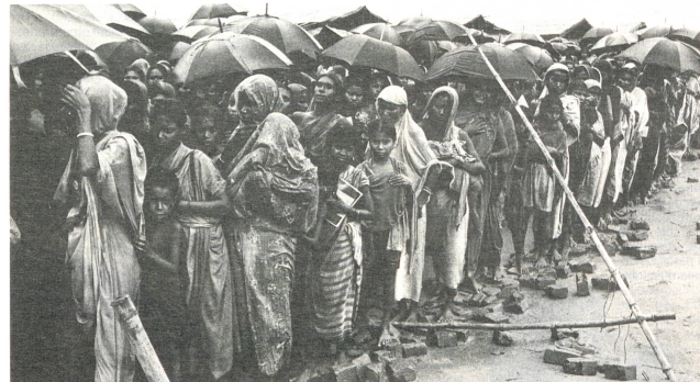
Par Maya Jurt, correspondante à l'ONU, Genève

L'odyssée de ces masses d'hommes et de femmes, de ces familles à la recherche d'une nouvelle patrie, affrontant les mers sur des embarcations surchargées, franchissant à pied des montagnes inhospitalières, se termine le plus souvent dans un camp de réfugiés. L'Afghanistan, le Cambodge ou l'Amérique centrale en sont les meilleurs exemples. En outre, réfugiés et famine vont souvent de pair. Ce n'est pas toujours ni seulement la guerre qui pousse les hommes à franchir les frontières. En Afrique, la famine est la cause principale du déplacement des réfugiés.