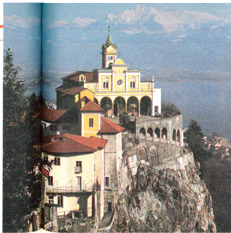
Locarno, sans soucis lors de la Fête des Fleurs et refléchi du haut de la Madonna del Sasso, accueillera, les 15 et 16 juin prochains, la centième Assemblée des délégués de la Croix-Rouge suisse.