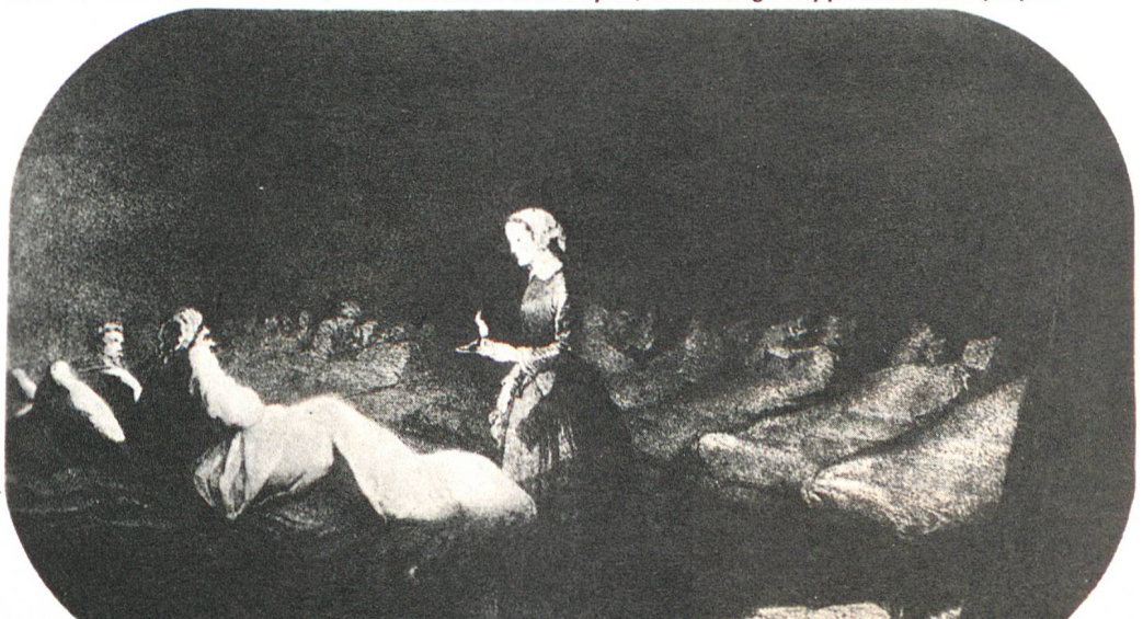
La «Dame à la lampe»; cette image frappa toute une époque.

Si ces deux êtres ont été foncièrement différents quant à leurs entreprises, ils ont néanmoins un point commun: leur sensibilité face à la souffrance humaine. Nous avons vu que l'histoire a retenu Florence Nightingale sous la forme de «La Dame à la lampe». Cette même histoire a retenu Henry Dunant sous celle de «L'Homme en blanc». S'il en est ainsi, croyons-nous, c'est qu'ils étaient bien tels pour tous les blessés et malades qu'ils approchaient. Ils étaient l'un et l'autre symboles de clarté, de soulagement et d'espoir, car c'est bien l'amour du prochain qui était leur première motivation. La Croix-Rouge se veut-elle autre chose? □