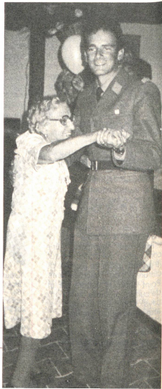
Au Gros-Prarays: Depuis combien de temps n'avait-elle plus dansé?