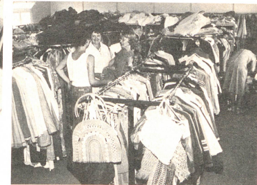
Bourse aux vêtements: Au Mourat, des habits de seconde main sont revendus à prix très bas. Et quel choix! Vous y trouverez même un «Brotz» ou une robe de mariée.

Outre la somme à déboursier, un autre obstacle ralentit l'installation des soins à domicile. Chacun des sept districts du canton de Fribourg possède son hôpital. Et chacun place son point d'honneur à ce qu'il tourne. Et voilà que les soins à domicile arrivent soudain comme une dangereuse concurrence qui pourrait nuire à son bon fonctionnement. Et pour cause: ils promettent une hospitalisation retardée et un retour à domicile plus rapide. C'est juste et faux à la fois.