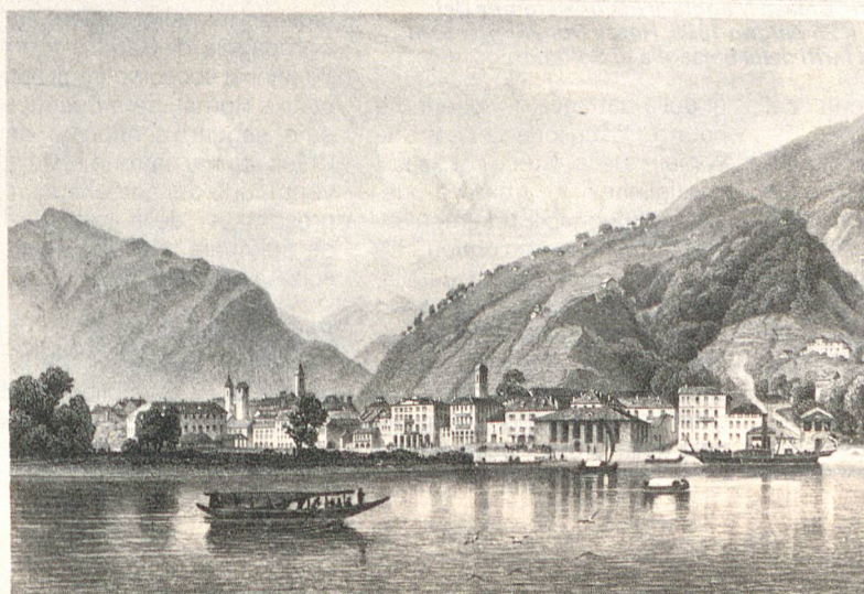
Locarno, capoluogo cantonale, verso il 1860. A sinistra, il palazzo del Governo.

quattro secoli la nostra regione è confrontata a questo problema non permetterà certo di risolverlo. Tuttavia, grazie alla conoscenza del passato possiamo percepire meglio la complessità dell'attuale problema. Quest'ultimo non è isolato nel tempo e trova le sue radici agli inizi del sedicesimo secolo allorché gli svizzeri occuparono la regione isolandola culturalmente e politicamente dalle terre lombarde. □