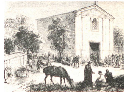
Le seul document d'époque: ambulance établie au pied de Solferino (croquis de Gaidraul, gravé par l'Hernaut, juillet 1859).

Dunant, au centre d'une histoire et d'un monde, d'un temps et d'un espace, a mis-