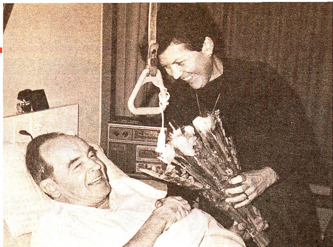
Les volontaires de la Croix-Rouge feront 20 000 heureux.