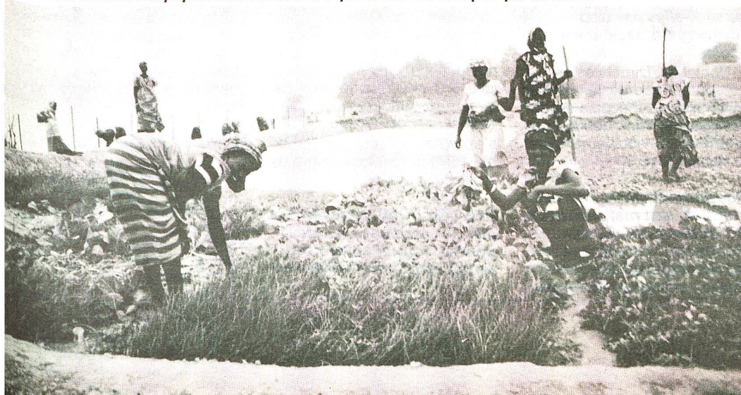
Seule la volonté des populations locales fera que la terre ne sera pas que du sable.

La CRS continuera à surveiller le programme en cours, avec la volonté de rester constamment attentive au moral des populations, à leur capacité de s'adapter aux nouvelles conditions de vie. Elle reste également prête à modifier le cours du programme en fonction de l'apparition de nouveaux besoins. Elle aura également l'occasion de prévoir d'autres participations dans des domaines différents, comme celui de l'artisanat. Le retour à l'indépendance économique, sociale et culturelle d'une partie de la population mauritanienne et la poursuite de l'aide dépendent donc, en définitive, de l'engagement et de l'intérêt montrés par cette population. L'intervention de la Croix-Rouge suisse en Mauritanie est la première du genre et a toutes les chances de se révéler beaucoup plus utile que certains autres projets de conception plus traditionnelle, parfois trop éloignés des vrais besoins et qui, au lieu de résoudre les problèmes, en provoquent d'autres, parfois plus graves. □