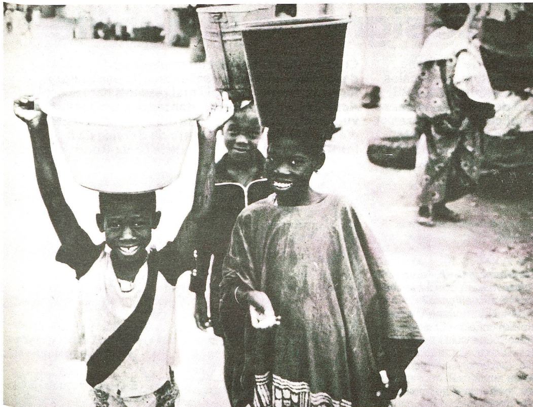
L'eau, un élément vital, dont dépend l'avenir des jeunes.

d'eau, le déboisement a favorisé l'avancée du désert. Le chef du campement a déclaré à Dieter Achtnich qu'il y a quelques années sa famille était considérée comme riche.