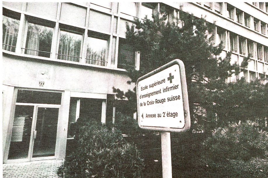
Une annexe de l'ESEI, route d'Oron à Lausanne. L'emménagement dans de nouveaux locaux situés à Vennes est prévu pour 1987.

L'ESEI est une institution de formation permanente comparable à toute autre. La formation qu'elle donne dépasse les frontières cantonales. Demain, à Neuchâtel ou à Châtel-Saint-Denis, à Sierre ou à Nyon, les besoins en personnel soignant seront les mêmes. A l'ESEI, ce jour-là, il y avait des Italiens, des Français, une Hollandaise, des Suisses de toutes les régions linguistiques. La preuve est faite que le savoir infirmier n'a pas de frontières. □