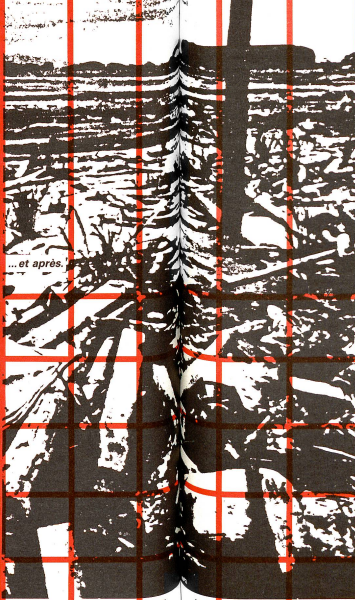
... et après.