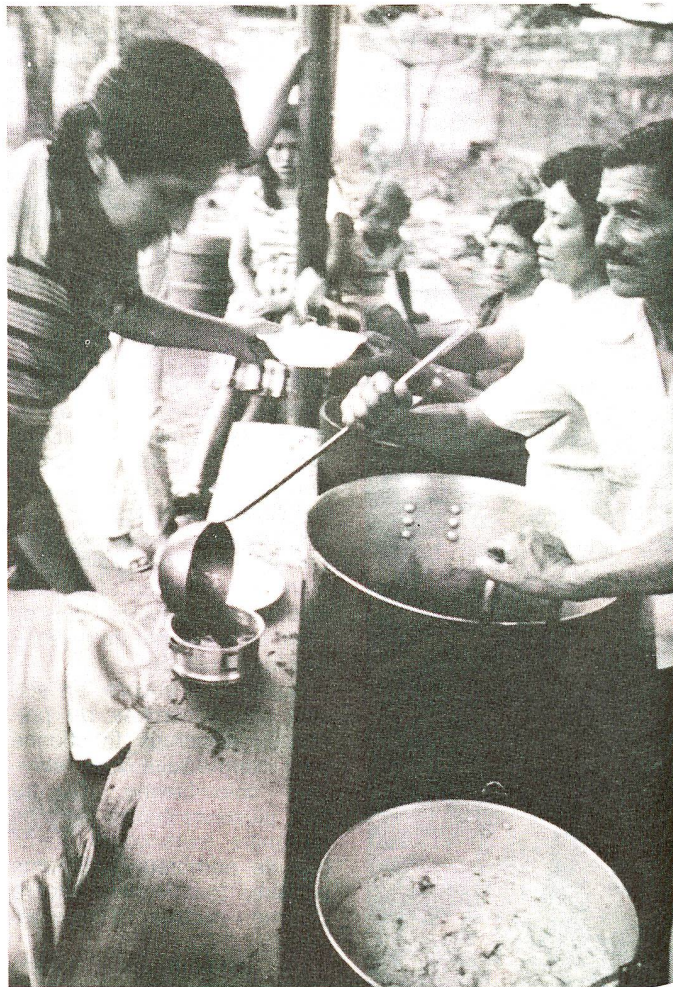
Distribution de nourriture dans le camp de Lériida.

Dès l'annonce de la catastrophe, la Croix-Rouge suisse a envoyé sur place 1000 tentes, destinées à l'hébergement des rescapés. Actuellement, la Croix-Rouge suisse procède à l'évaluation des projets possibles de reconstruction et de réhabilitation, pouvant contribuer à une amélioration structurelle à long terme.