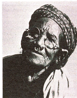
Des lunettes au lieu de la cécité. Cette femme peut de nouveau se subvenir à elle-même.

On ne se contente pas de soigner les maladies, dans cet hôpital. Il s'agit plutôt d'empêcher leur apparition! En effet, la carence en vitamine A et les maladies infantiles entraînent souvent une cécité irréversible. Il est possible de l'éviter en informant la population, grâce à des moyens financiers peu importants. Il faut aussi parvenir à une amélioration des conditions d'hygiène.