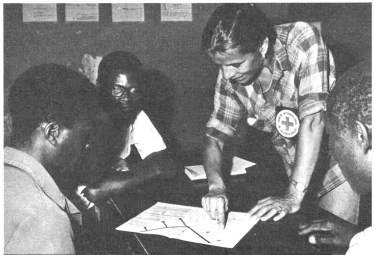
Angola, nov.-déc. 1985. Une infirmière en train de donner un cours sur la dysenterie à des infirmiers angolais. La formation du personnel local entre dans les tâches de l'infirmière du CICR.

L'infirmière travaille soit dans un dispensaire fixe, soit avec une équipe itinérante qui effectue des consultations dans des villages, des camps de personnes déplacées, etc. Dans les deux cas, l'infirmière