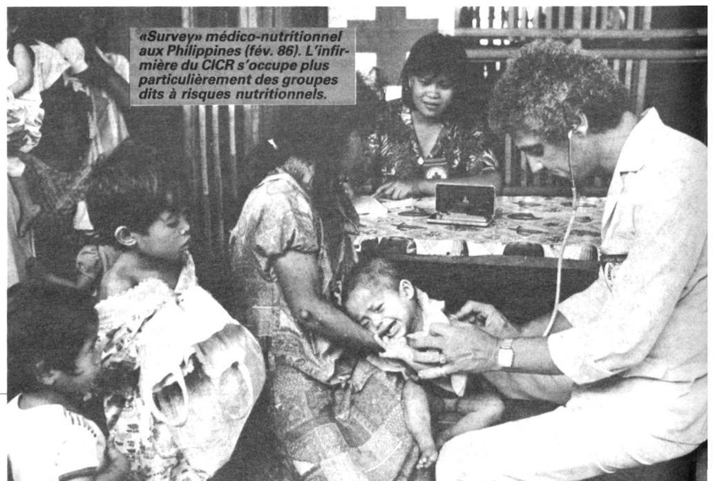
«Survey» médico-nutritionnel aux Philippines (fév. 86). L'infirmière du CICR s'occupe plus particulièrement des groupes dits à risques nutritionnels.