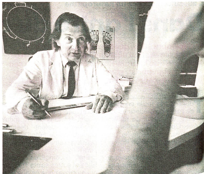
Une consultation qui commence presque comme chez le médecin traditionnel...

répète plusieurs fois. Percevant mon étonnement, il m'explique, en profitant d'un moment d'apaisement, qu'il est en train de capter mon énergie et de rétablir un circuit énergétique normal. Une irrésistible envie de m'assoupir m'envahit, juste avant, je tiens à le préciser, qu'il ne m'avertisse des effets immédiats qu'une telle thérapeutique peut avoir sur le patient, notamment la somnolence. Puis il cesse, reprend sa règle et sa planche anatomique. Miracle, le pendule se met à osciller! «L'énergie a été rétablie dans votre estomac. Mais ce n'est pas fini, il s'agit de voir pourquoi vous perdez cette énergie». Il prend à nouveau différentes planches, où sont inscrites