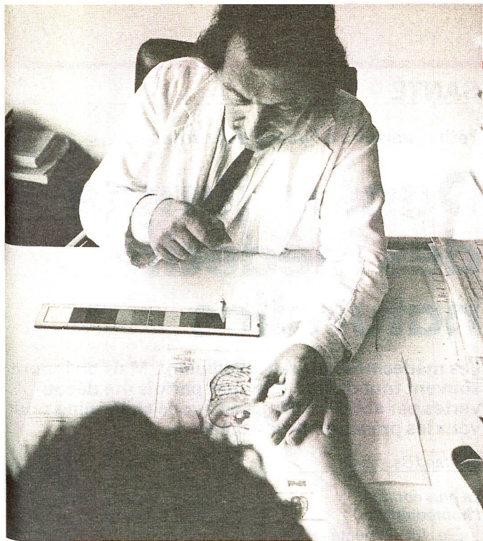
La mesure de l'énergie des organes. Le radiesthésiste se sert d'une règle, appelée règle d'Argus, et de son pendule.

Le moment le plus spectaculaire de la consultation: après avoir localisé la perturbation énergétique, le praticien capte l'énergie du patient et opère par transfert d'énergie pour rétablir une circulation énergétique normale.