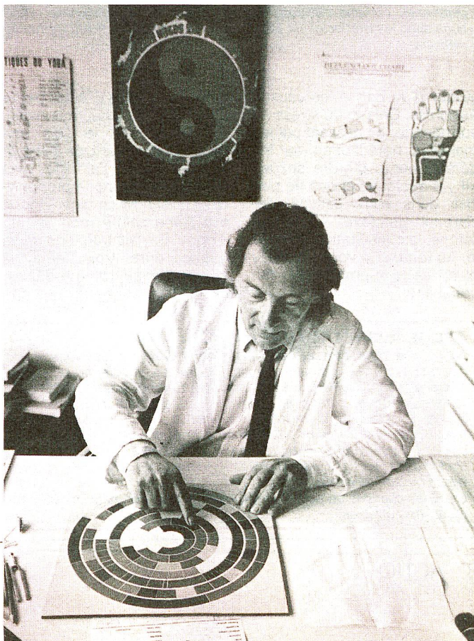
La table universelle des couleurs. Conçue par un ingénieur, cette table permet de mesurer les vibrations de tout corps, vivant ou non vivant.

P. W. ne les dissimule pas. La pratique de la radiesthésie demande une très grande concentration, la neutralité absolue, qu'il est parfois impossible d'atteindre. De plus, certaines maladies sont pour nous difficilement guérissables. Le cancer représente le stade ultime et le plus grave d'un dérèglement énergétique dans l'organisme. Les radiesthésistes l'expliquent comme une rupture totale de l'équilibre entre le monde des causes et celui des effets, et par une totale confusion entre ces deux mondes à l'intérieur de l'organisme. Il est très difficile d'intervenir et injustifié de la part d'un radiesthésiste d'affirmer d'emblée qu'il guérira un cancer.