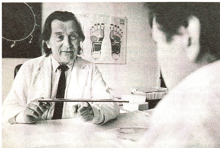
L'objectif de la radiesthésie médicale: rétablir l'équilibre énergétique.

La recherche de la cause des troubles du patient. Le radiesthésiste questionne son pendule et en interprète les mouvements, au-dessus d'une table de réponses possibles.