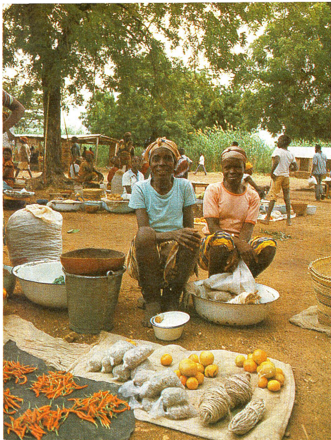
Marché à Zébilla: comme légumes, on trouve des tomates et des poivrons.

Zébilla est situé dans une région de savanes qui s'étendent à perte de vue. Des petites collines apparaissent vers le nord, de gros baobabs viennent rompre la monotonie du paysage.