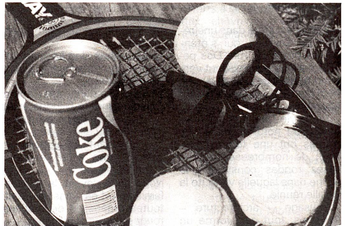
La coke civilisation est née.