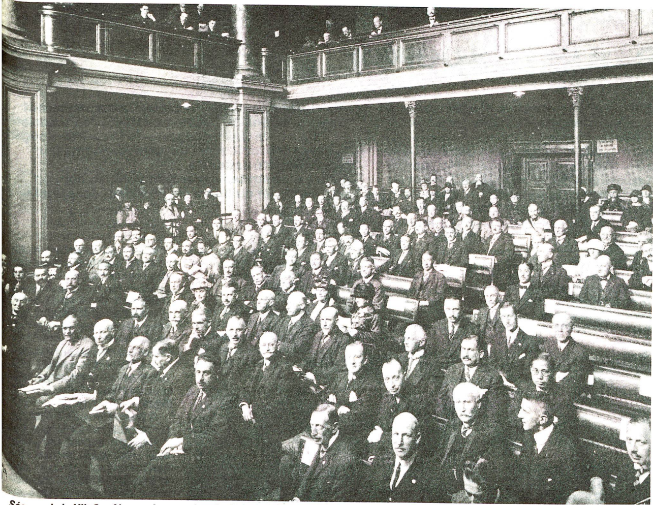
Séance de la XII e Conférence internationale de la Croix-Rouge à l'aula de l'Université de Genève en octobre 1925.

aboutissent non pas à une véritable fusion organique, mais à la création d'une association statutaire dans laquelle le CICR, la Ligue et les Sociétés nationales allaient constituer ensemble la Croix-Rouge internationale.