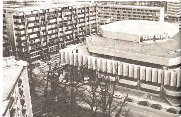
Le palais du CICR, cadre de la XXV e Conférence internationale de la Croix-Rouge.

- les représentants de 16 Sociétés de la Croix-Rouge ou du Croissant-Rouge en formation, - les représentants d'organisations internationales entretenant des relations suivies avec les institutions de la Croix-Rouge internationale (au total 77). Ces organisations peuvent être intergouvernementales, comme l'OMS (Organisation mondiale de la santé) ou non gouvernementales, comme le Conseil international des infirmières.