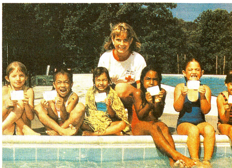
Cours de natation pour jeunes enfants. La Croix-Rouge américaine a mis sur pied toute une gamme de cours dans le domaine des sports aquatiques. Leur but est de promouvoir une plus grande sécurité et par là même d'accroître le plaisir que l'on peut retirer de la pratique de ces sports.