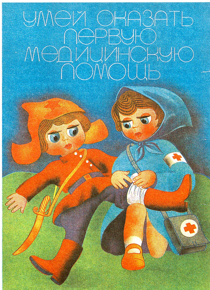
Affiche invitant les jeunes à apprendre les bases du secourisme. L'affiche est un moyen de propagande très utilisé par la Croix-Rouge soviétique.