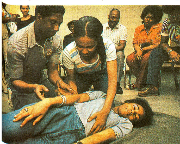
Cours de premiers secours pour volontaires.