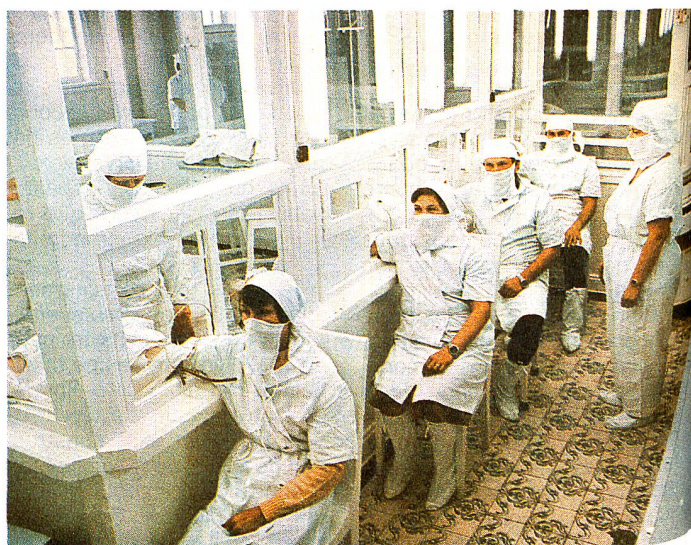
Séance de prélèvement de sang. Le don du sang est considéré en URSS comme un «devoir patriotique».

Dorogaya siostra, je pourrais encore t'écrire des pages et des pages sur ce que je fais, en particulier pour la propagande. Peut-être lis-tu régulièrement ma revue, qui tire à plus d'un million d'exemplaires. Tu es trop loin pour recevoir la télévision ou la radio de chez nous. Sinon, tu m'y verrais et m'y entendrais plus souvent. Je te quitte donc, en espérant apprendre bientôt ce que tu deviens. Do zvidania. □