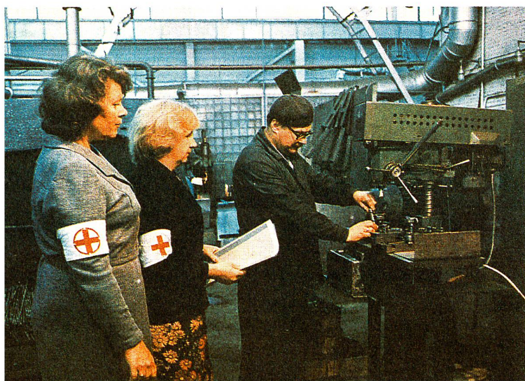
Inspecteurs sanitaires effectuant leur travail de contrôle. La Croix-Rouge soviétique est très présente dans les entreprises. Chaque entreprise dispose d'un «sanpost», poste sanitaire, où les accidentés du travail reçoivent les premiers soins.