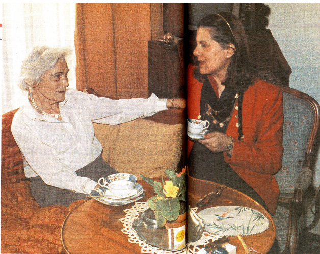
Une invention géniale