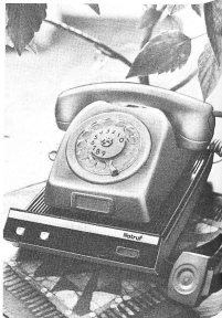
Le système Ericare est raccordé au réseau des PTT et peut fonctionner dans l'ensemble du pays.

Une simple pression du doigt suffit pour appeler la centrale d'alarme.