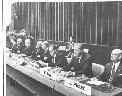
La plus haute autorité délibérante du Mouvement international de la Croix-Rouge et du Croissant-Rouge, ainsi que les modalités de la nécessaire coopération entre le monde de la Croix-Rouge et les Gouvernements appellent un examen approfondi.

Les participants à cette entrevue ont estimé que les résultats concrets de la Conférence peuvent être considérés comme positifs. La révision des Statuts de la Croix-Rouge internationale ainsi que l'adoption d'une série de résolutions importantes sont de nature à donner de nouvelles et importantes impulsions au travail de la Croix-Rouge à travers le monde. Ils sont cependant de l'avis que le rôle et le fonctionnement de la Conférence internationale de la Croix-Rouge,