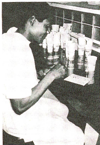
Mozambique L'élaboration d'un projet, surtout sous son aspect financier, est extrêmement complexe.

Parmi toutes mes activités à la Croix-Rouge, la plus difficile consiste à devoir juger de façon objective la participation personnelle et la capacité financière de nos organisations partenaires (Sociétés Croix-Rouge nationales et ministères de la santé) lors de la conception des programmes de développement. Contrairement à l'aide humanitaire d'ur-