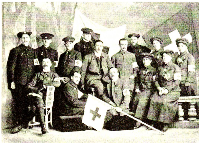
Vue du personnel de «l'Ambulance Vaud-Genève», envoyée en Grèce par les sections genevoise et vaudoise de la Croix-Rouge suisse.

Répondant à ces appels, la Direction de la Croix-Rouge suisse décida d'organiser dans tout le pays «une collecte de dons en argent». Le 24 octobre 1912, elle envoya une circulaire à tous les présidents de section, les invitant «à se mettre à l'œuvre sans tarder afin de nous permettre d'intervenir sous peu et de coopérer au soulagement des victimes de la guerre actuelle, tout en