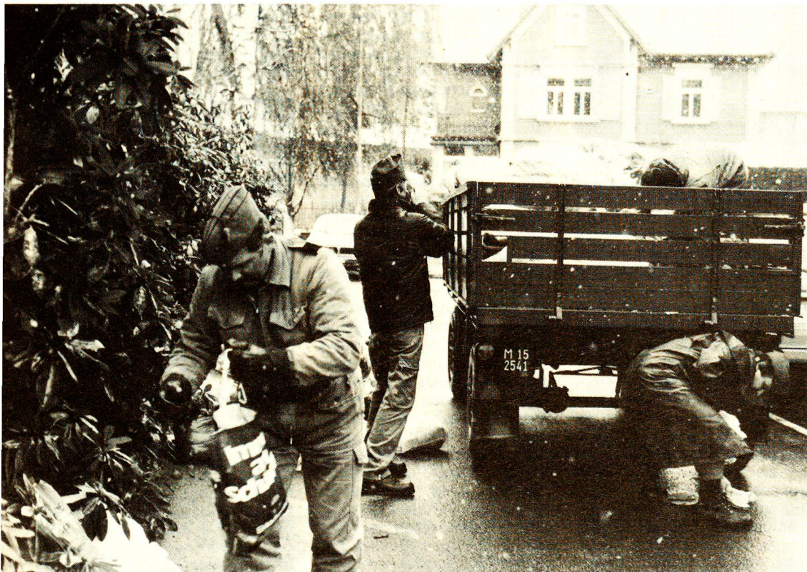
Quelque 300 000 kg de vêtements usagés sont recueillis chaque année lors de la traditionnelle collecte de la section.

La section d'Aarau, qui regroupe les districts d'Aarau, de Brugg, de Kulm, de Lenzburg et de Zofingen, a cependant ajouté de nouvelles prestations à l'éventail des services traditionnels. Le système d'appel d'urgence «Ericare» est particulièrement important pour les personnes âgées ou malades car il leur permet, lors d'un malaise ou d'une chute, d'avertir une centrale 24 heures sur 24 par simple pression sur un petit dispositif porté au poignet. La section loue ces appareils à