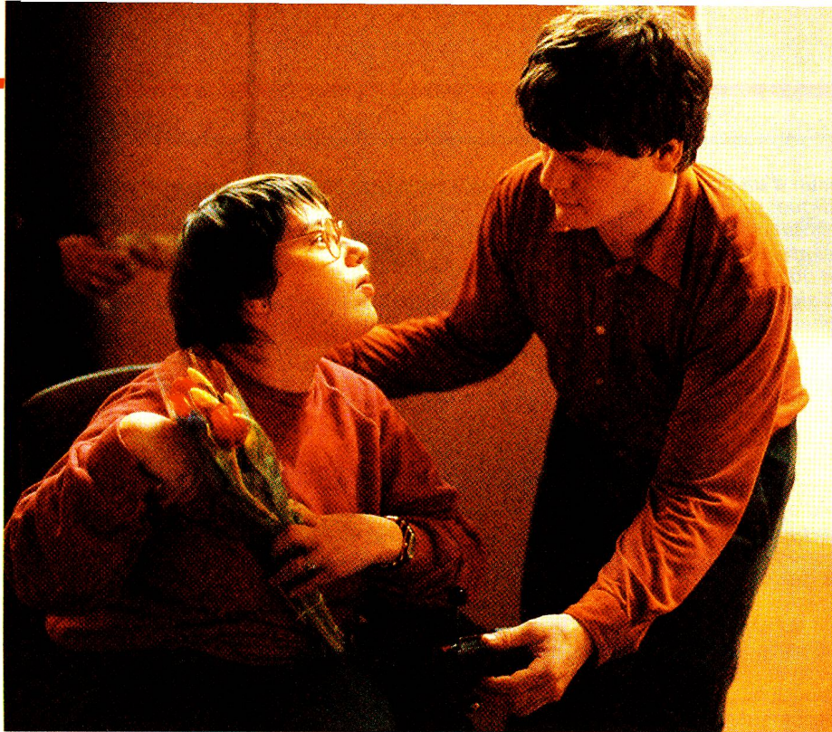
Cornélia, qui, dans «Tout feu, tout flamme», joue le rôle de la désinvolte Eva, amoureuse éperdue, révèle dans cette représentation une partie importante d'elle-même.

pêche le spectateur de se laisser aller à trop d'émotivité.