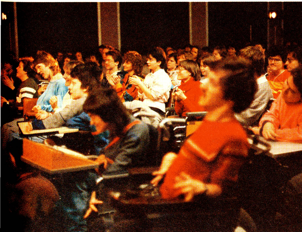
Un public qui a fortement réagi au spectacle: les handicapés de Rossfeld, dont le propre destin devenait une réalité.