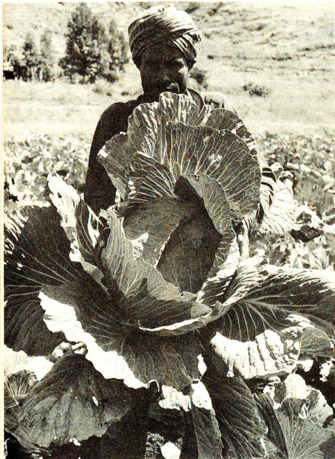
Récolte de choux dans le cadre d'un projet de développement rural intégré à Ardibo (région du Wollo). «Aider la paysannerie à tirer le meilleur profit des terres agricoles du pays.»