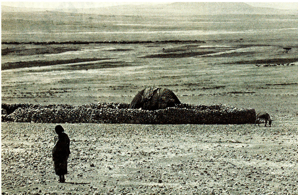
Un des Etats les plus pauvres de la planète, avec un revenu annuel moyen par habitant de 110 dollars.

Difficile, à l'heure actuelle, de présenter un bilan objectif de l'Ethiopie d'aujourd'hui. Yvonne-Marie Ruedin, collaboratrice auprès du Centre d'information tiers monde à Lausanne, de retour de ce pays, nous propose cette appréciation nuancée d'une situation complexe, où les points de vue les plus contradictoires trouvent une justification.