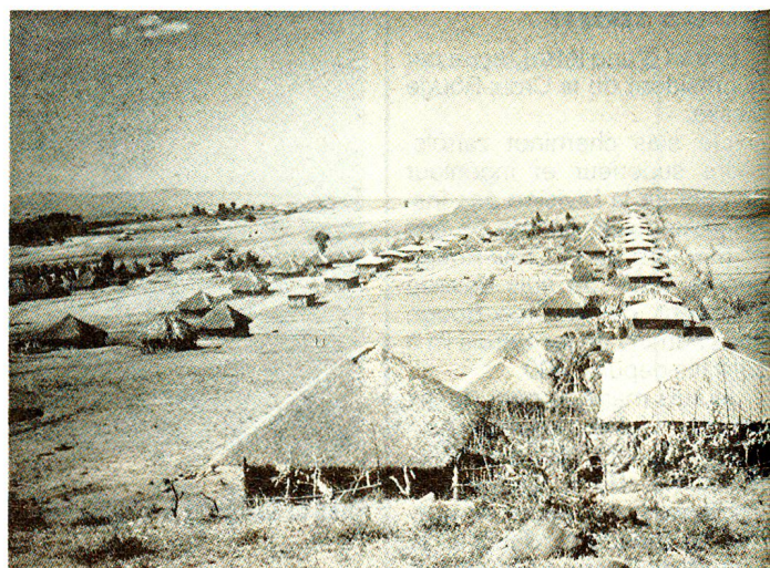
Nouveau village dans la province de Harar. Le programme de «villagisation» touche déjà trois millions de personnes.

Tant au nord (Fronts populaires de libération de l'Erythrée et du Tigré) qu'au sud-est (Fronts de libération Oromo, Afar et Somali), la guérilla revendique par les armes l'indépendance ou, tout au