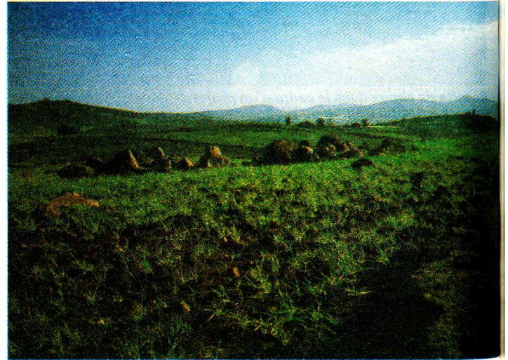
Août 1985. Les pluies sont revenues et la terre a reverdi. Mais les paysans n'ont pas le matériel suffisant pour ensemençer et cultiver leurs champs.

Une nature verte s'étendait à perte de vue, lorsque nous avons traversé pour la première fois en août 1985 les districts de Tegelut et Bulga. Il semblait au premier abord in-