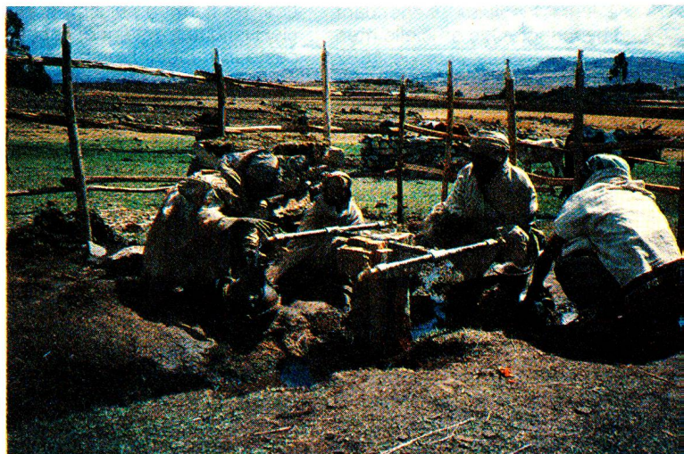
La protection des sources permet de garantir aux régions rurales un approvisionnement correct en eau potable, élément important en vue de l'amélioration à long terme de l'état sanitaire de la population.

Les dernières évaluations de la CRS mettent en évidence la nécessité de renforcer l'autonomie de la population. A l'avenir, nous envisageons d'améliorer l'état sanitaire des populations de la région couverte par le programme. De notre point de vue, l'accent doit être mis plus sur la prévention des maladies déclarées que sur la guérison proprement dite. Par exemple, une eau propre permet d'éviter les dysenteries, le typhus et le choléra souvent mortel. Or pour garantir cet approvisionnement en eau potable, il suffit simplement d'appliquer quelques mesures appro-