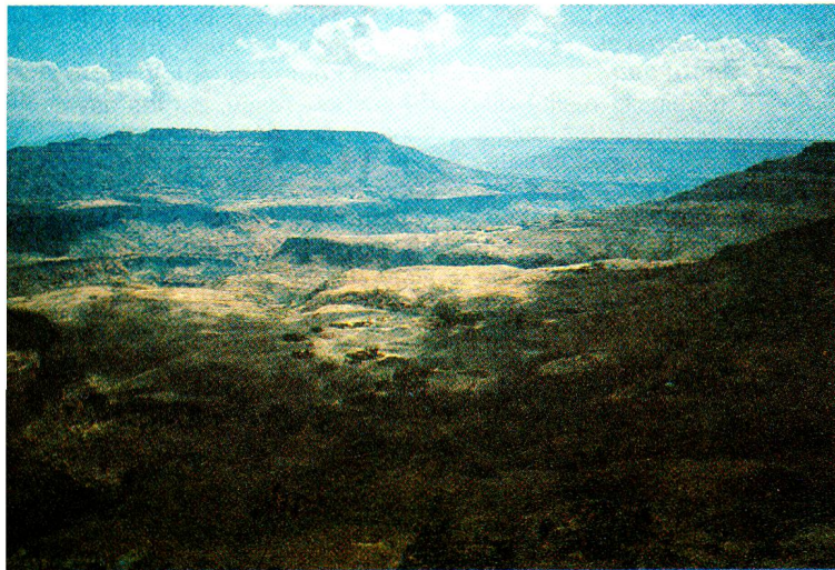
Les districts de Tegelut et Bulga sont sillonnés de vallées profondes. Les paysans y vivent en habitat dispersé.

zones troublées du pays; elle participe également au programme d'aide de la Croix-Rouge éthiopienne dans les régions touchées par la sécheresse. Elle est convaincue que l'on doit encore poursuivre l'aide au développement dans ce pays. La misère des nomades et des paysans éthiopiens n'a pas disparu. Le danger toujours latent d'une nouvelle sécheresse, auquel s'ajoute la profonde instabilité sociale, fait craindre aux obser-