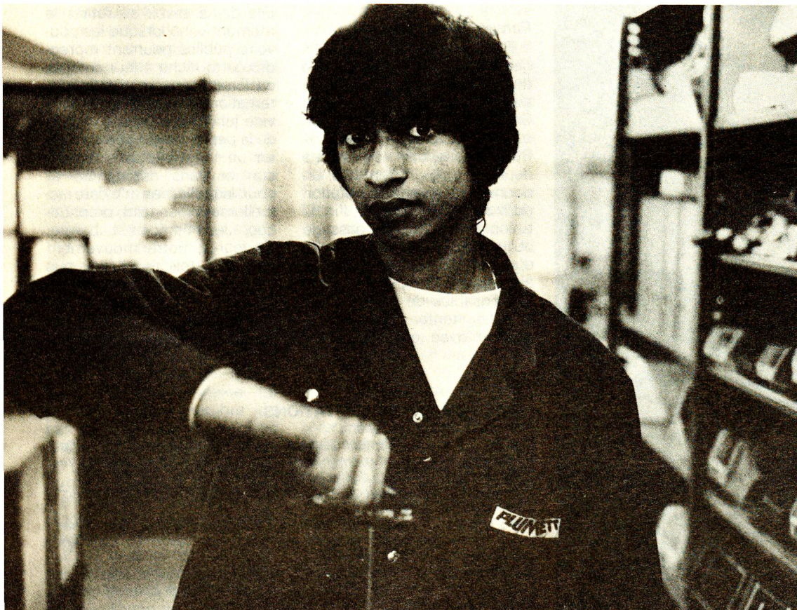
Un jeune Tamoul a trouvé de l'embauche dans l'entreprise Plumettaz, à Bex. Ce chef d'entreprise bellerin a mis sur pied un bureau de travail temporaire pour les demandeurs d'asile provisoirement hébergés au centre Croix-Rouge. Ce service a été confié à un réfugié mozambicain.

Loin de lui l'idée de couvrir des actions clandestines. Il agit à cœur ouvert, en toute légalité, mais ne se gêne pas de tirer la sonnette d'alarme lorsque la justice rend un jugement particulièrement inhumain, comme une menace