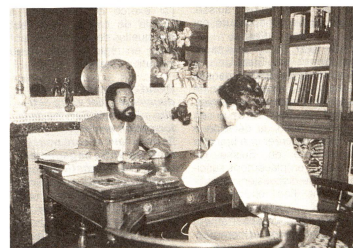
Les conséquences sociales de la crise des années 80 ont rendu nécessaire la création de lieux d'écoute et d'accueil. La Croix-Rouge française a notamment favorisé la mise sur pied de permanences ou de bureaux d'assistance pour les «Sans Domicile Fixe» et en général pour ceux que l'on appelle les «nouveaux pauvres».

Fin 1986, à la demande du ministre délégué chargé de la Santé et de la Famille, la Croix-Rouge française est maître d'œuvre de l'opération «Téléphone vert Santé». L'action s'inscrit dans le cadre d'une campagne d'information et de sensibilisation sur le thème «La drogue, parlons-en avant qu'elle ne lui parle». Il s'agit de briser le mur de silence entourant les problèmes de drogue et de rétablir le dialogue, peut-être rompu ou inexistant, entre parents et enfants. Pendant six semaines, cent soixante dix personnes, issues de dix-neuf associations ou organismes différents et sélectionnées par la Croix-Rouge, se relaient pour répondre aux demandes téléphoniques concernant la drogue et, plus largement, toute forme de toxicomanie. Les appels émanent en majorité — près de 55% — de jeunes de moins de dix-huit ans, révélant le sentiment de solitude des jeunes adolescents et leur désir de communication. La Croix-Rouge française retient l'enseignement.