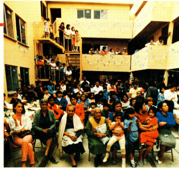
La reconstruction est finie. C'est l'heure de la «Fiesta». Ces dernières semaines, on inaugure, à Mexico, de nombreuses «vecindades» reconstruites par la Croix-Rouge suisse.

La Croix-Rouge suisse a remis aux habitants la propriété de ces appartements. Cependant il ne s'agit pas de simples cadeaux. Les «nouveaux propriétaires ont l'obligation d'alimenter un fonds de solidarité, destiné à l'entretien des maisons, à l'éventuelle construction d'autres habitations ainsi qu'à la mise sur pied d'une infrastructure communautaire selon les vœux